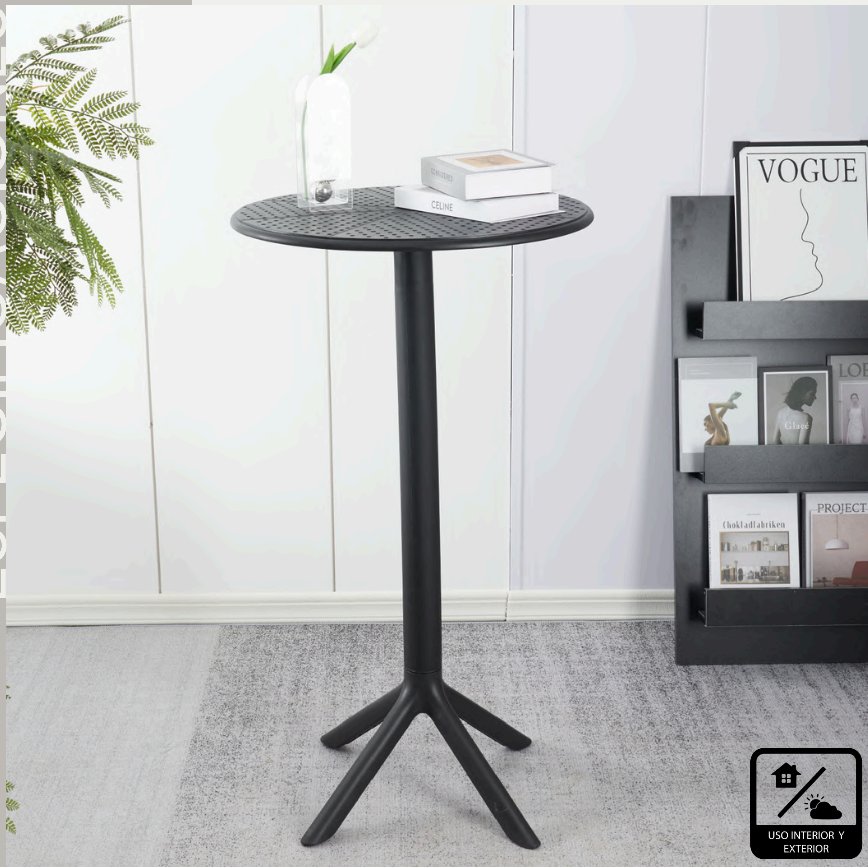
MEDIDA DISPONIBLE 60x60x105cm (ancho x largo x alto)