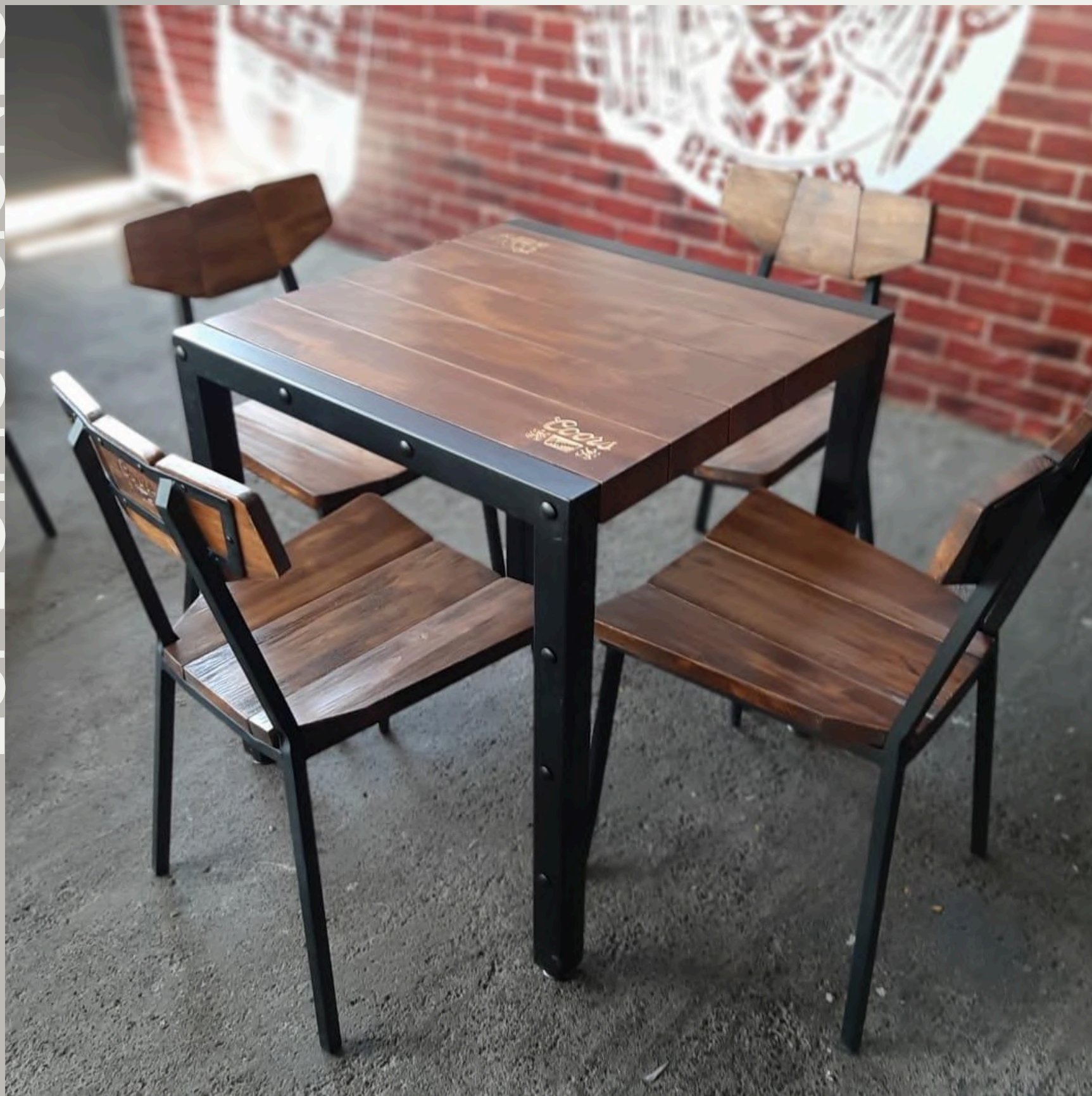
MEDIDAS DISPONIBLES A PEDIDO