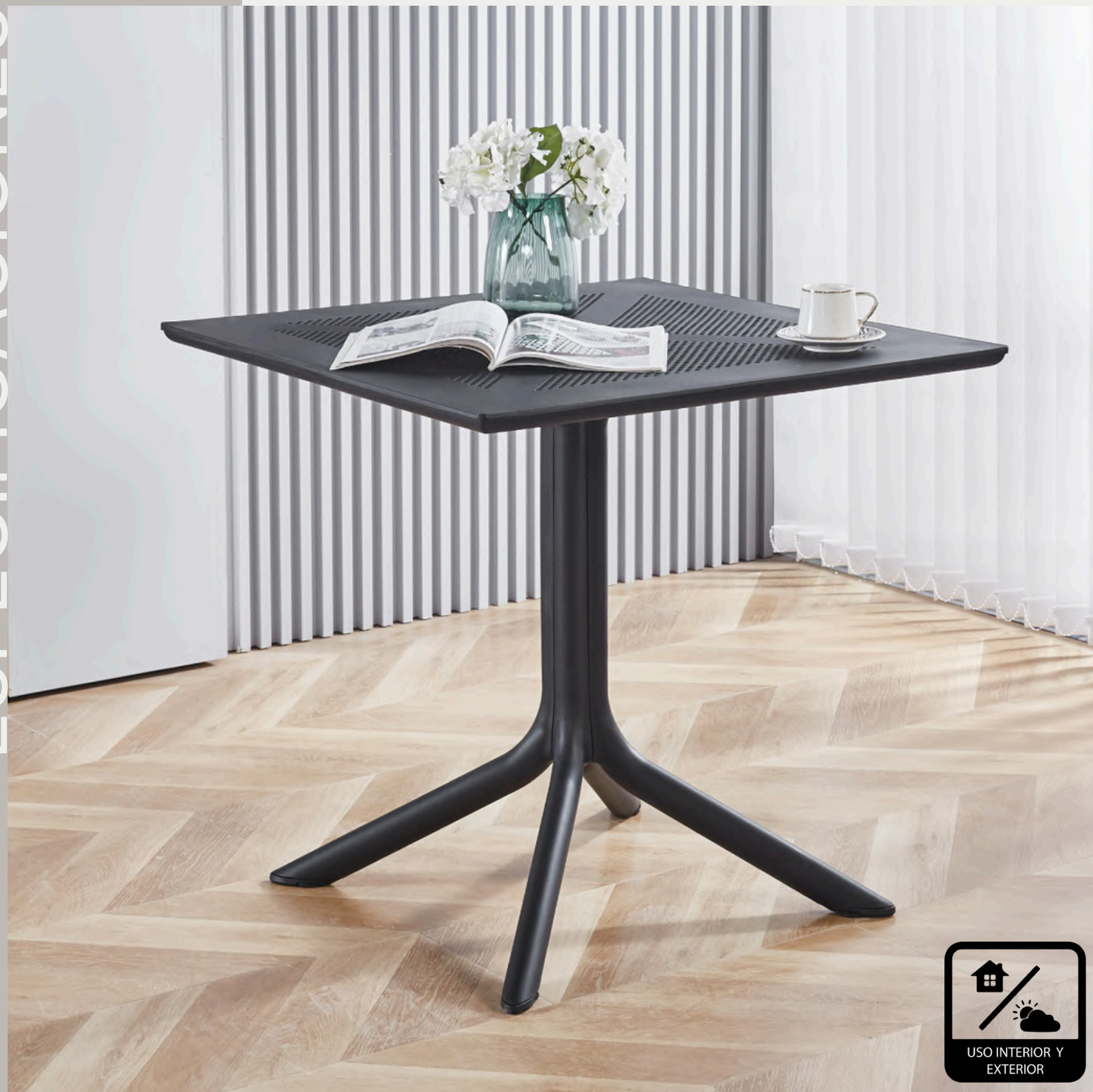
MEDIDA DISPONIBLE 80x80x75cm (ancho x largo x alto)