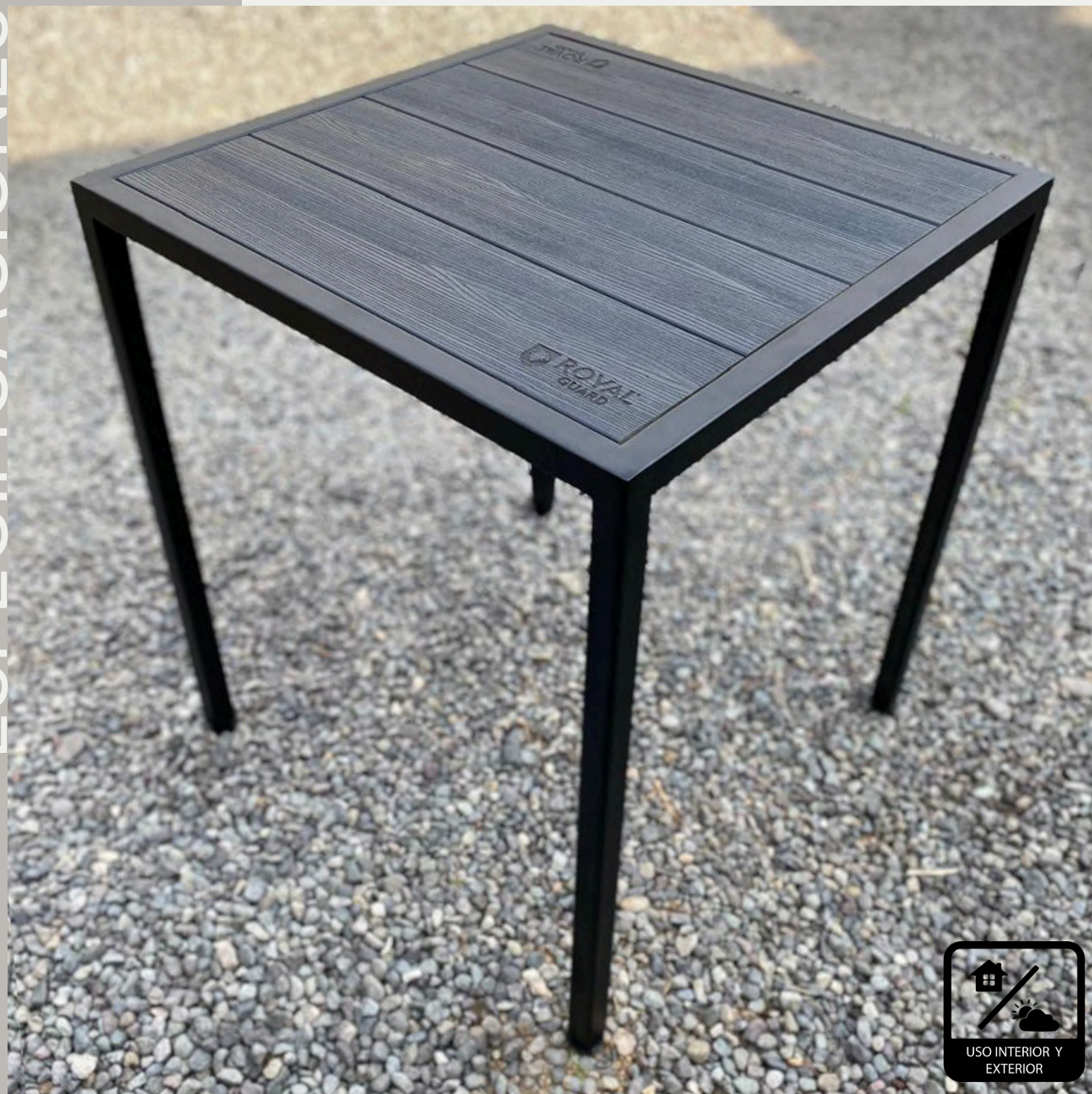
MEDIDA DISPONIBLE 65x65x75cm (ancho x largo x alto)